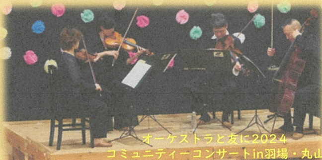
オーケストラと友に2024 コミュニティコンサートin羽場・丸山