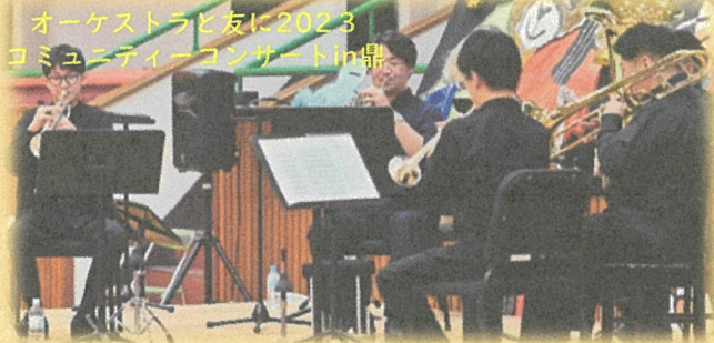
オーケストラと友に2023 コミュニティコンサートin龍江