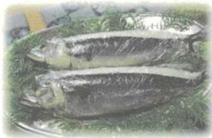
←写真は鯖寿司の姿寿司のイメージです。実物は切ってタッパーに入っています。