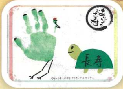
おむすびっ子より