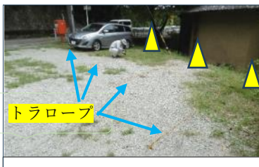
砂利は固く締まっただけで苦労しました