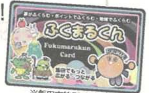
※飯田市特別デザイン

※ふくまるくんカードをお持ちの方及び新規お申込みの方には、随時300ポイントプレゼントしています。加盟店またはスマホアプリでご確認ください。