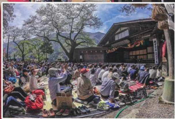
「鎌倉三代記 三浦別れの段」大鹿村 大碩神社にて

◎平安堂飯田店(☎0265-24-4545) / 平安堂座光寺店(☎0265-23-4646)