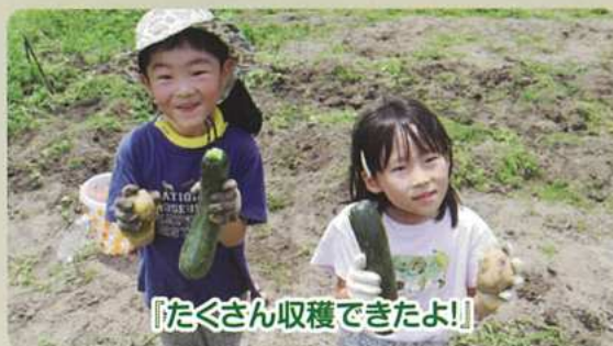
「たくさん収穫できたよ!」

【昨年度の参加者の感想より抜粋】今回オーガニックファームに参加し、多種類の野菜の成長過程や草取り、虫の駆除、収穫まで有機で育てる大変さを知る事ができ大変有意義な体験をさせていただきました。子どもに何が良かったか聞いた所、とうもろこしを食べた事だそうです。無農薬の生のとうもろこしを食べた事は私自身も初めてで、とても貴重で贅沢な体験でした。子どもが美味しそうにかぶりつく姿がとても印象に残っています。