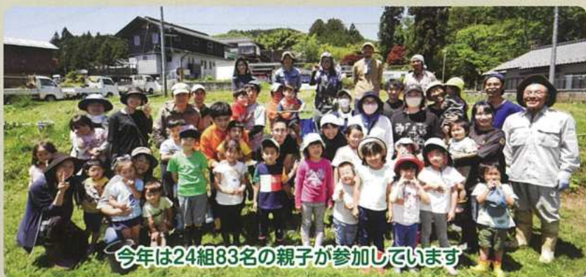
今年は24組83名の親子が参加しています