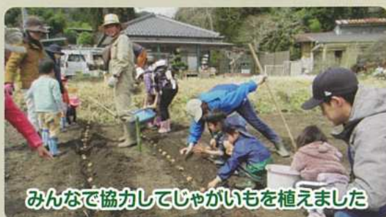
みんなで協力してじゃがいもを植えました

飯田市農業課では市民の皆さんに有機農業への理解を深めてもらうため、市内の保育園や認定こども園に通う子を持つ親子を対象に「オーガニックファーム(有機農業の体験教室)」を開催しています。令和5年度から始めて今年は2年目です。4月～10月までの毎週土曜日にみんなで作業しています!