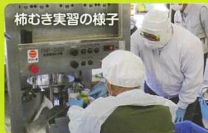
柿むき実習の様子