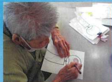
一人一枚オリジナルの風鈴作り、 来月の廊下を飾ります。