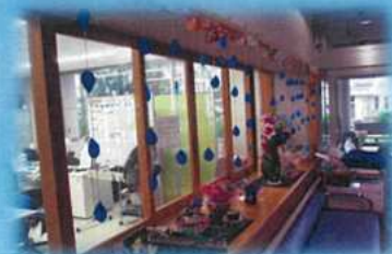
いつも頂いたお花で玄関がにぎやか です。ありがとうございました。