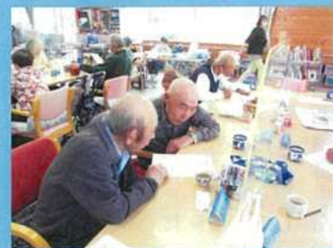
難しい問題も、仲間と相談すれば、 よし！わかった！