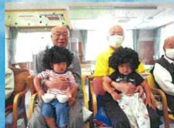
おむすびの園児が変装して登場