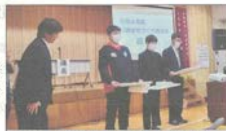
受賞された皆さん、おめでとうございます

南信州ラグビースクールの県メンバーとして活躍 第一回名古屋南ライオンズクラブ杯ラグビー交流会 優勝 第三回笑顔いちばんカップジュニアラグビー交流会 優勝 全国ジュニアラグビーフットボール大会(県代表)、 全日本大会、全国大会出場 に出場されました。