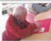
1カレンダーブック作り