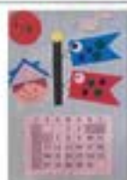
1ヶ月のカレンダー