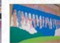
1空を歩く熊のぼり、熊のぼりの色は皆さんに塗って頂きました。