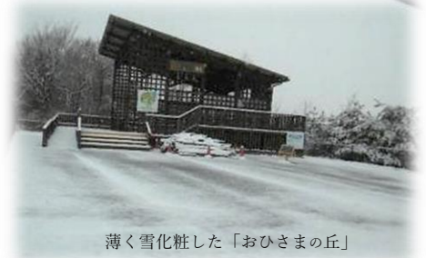
薄く雪化粧した「おひさまの丘」