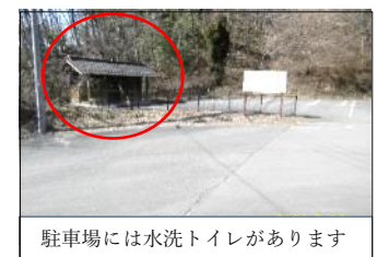
駐車場には水洗トイレがあります