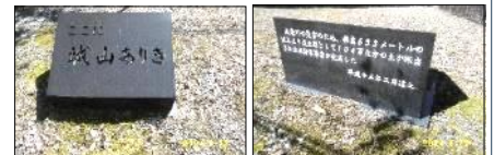
川路の盛土は、この城山土取場から搬出

これ以外にも皆さんのアイデア、夢のある提案をいただきたいです。まちづくり委員会へお寄せください！