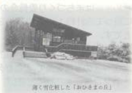
薄く劣化した「おひさまの丘」