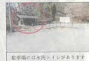
駐車場には水洗トイレがあります