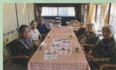
3月のカレンダー作り

2月1日～3日まで節分のボール投げ遊びをしました。はりきって、鬼の牛乳パックを倒していました。普段は無口で静かな人も、ゲームは夢中になって参加されます。