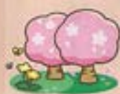
周辺の春めき桜を見て回りました