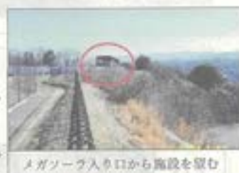
メガソーファ入り口から施設を望む