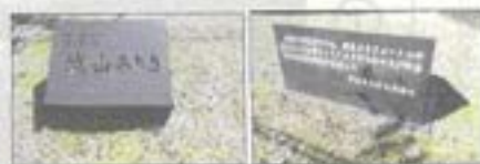
川路の盛土は、この城山土取場から搬出

これ以外にも皆さんのアイデア、夢のある提案をいただきたいです。まちづくり委員会へお寄せください！