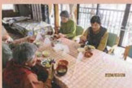
美味しい牡丹餅をお腹いっぱい食べました