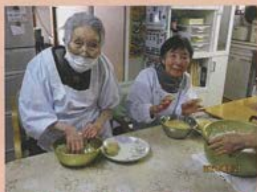
ご利用様にも協力してもらいました