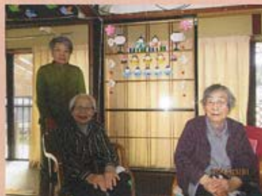
みんなで協力して作ったお雑炊