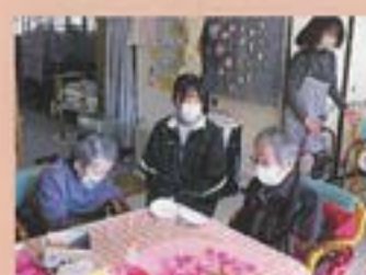
高校生が実習に来てくれました