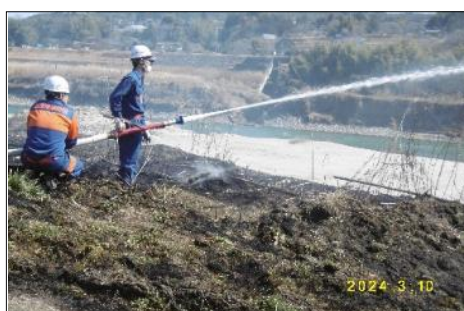
川路消防団の放水で延焼防止！