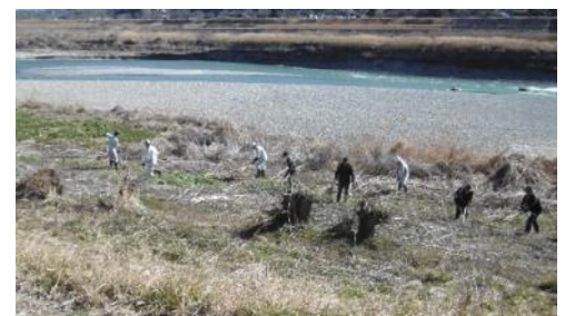
レーキで延焼防止帯を確保