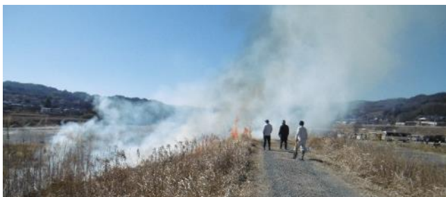
天気よし！ 風向き心配??