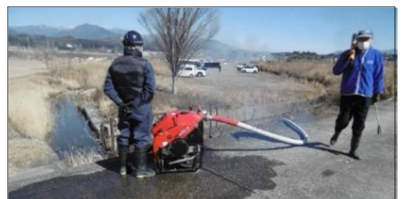
防災川路のポンプが活躍！

※ 野焼き終了後、まちづくり委員会役員は「春めき桜」の施肥、胴ぶき剪定を行いました。