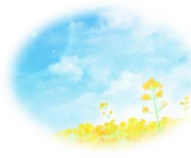
菜の花畑が楽しみ