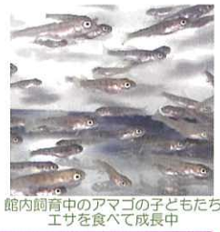
館内飼育中のアマガゴの子どもたち エサを食べて成長中