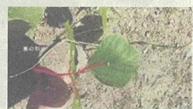
1本の茎から3枚の葉っぱ