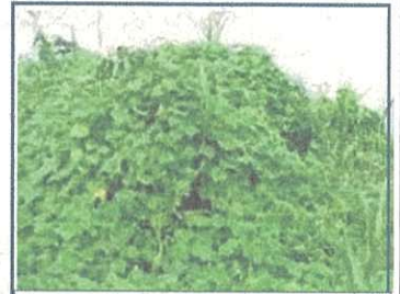
ツルを他の植物に巻き付けて枯らせませす 冬には枯れて、一帯がお化けのようです