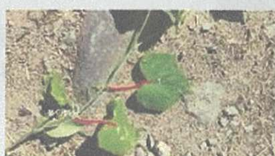
1本の茎から1枚の葉っぱ