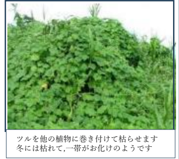
ソルを他の植物に巻き付けて枯らせませす 冬には枯れて、一帯がお化けのようです