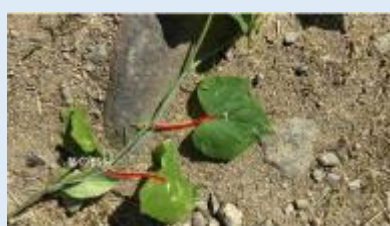
1本の茎から1枚の葉っぱ