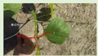
1本の茎から3枚の葉っぱ