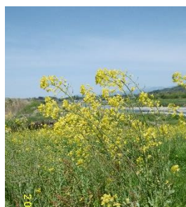
菜の花 花言葉：快活 明るさ