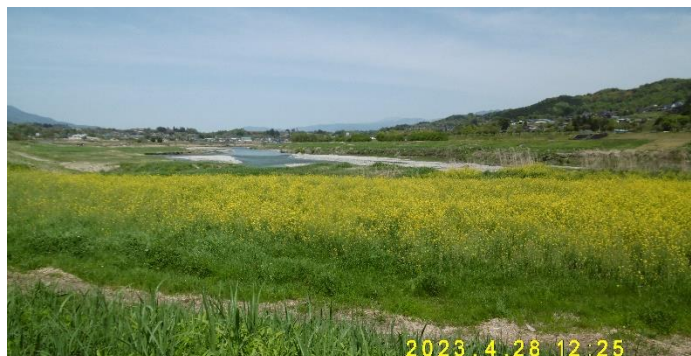
天竜川を背景に見事！ かわらんべ河川敷