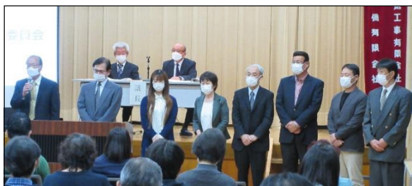
R5.6 年度新役員 挨拶