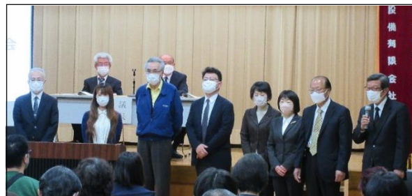
R3.4 年度役員 退任挨拶

そして、「今後の川路まちづくりは、地域を良くしたい、住みやすい川路にしたいと思う住民一人一人の自発的な行動にかかっている」と、期待と望みを託されました。