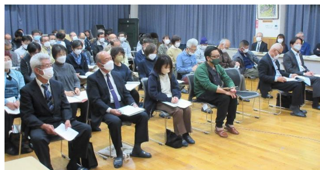
総会では議案第1号～議案第8号を審議