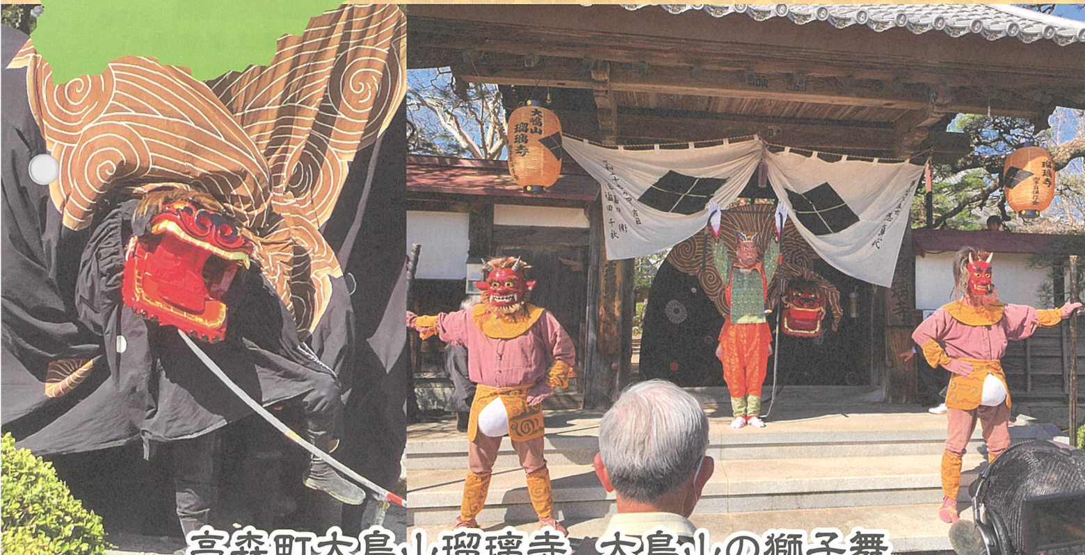
高森町大島山瑠璃寺 大島山の獅子舞