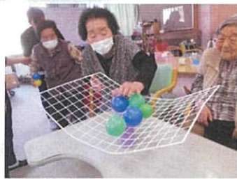
最初はどんどん乗せます。