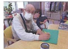
↓今月のカレンダー