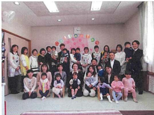
入園式 みんな泣かずに良い笑顔

4月になって新しいお友達を7名迎えました。今年度も2歳児7名、1歳児4名で元気におむすび保育園のスタートを切る事が出来ました。