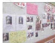
↑我が家のペット自慢！ どの子も可愛い♪