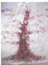
↑ホールの壁に皆さんで塗ったつつじを貼りました。