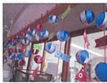
↑玄関先に鯉のつるし飾り