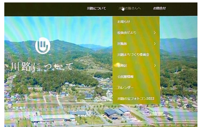
「川路の皆さんへ」の項目を開いた見た画面