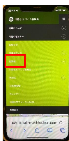
④「回覧板」をクリック