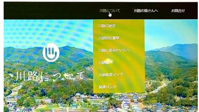
パソコンより川路まちづくり委員会サイトを見た画面